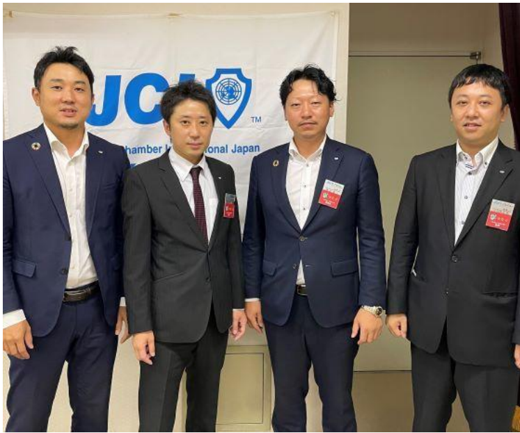
承認後、歴代理事長と記念撮影