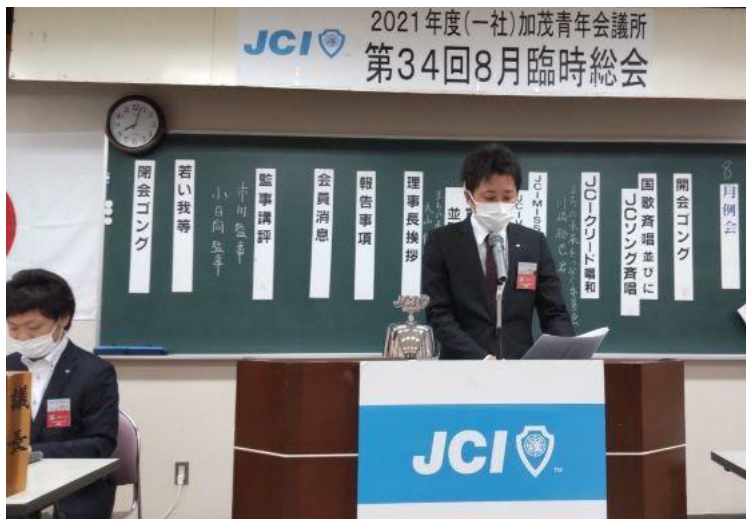
所信を朗読する市川次年度理事長予定者