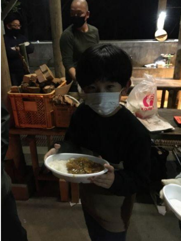
晩御飯の後には、キャンプファイヤー！ 盛大に燃える炎は、こども達の記憶に焼き付いたことかと思います。