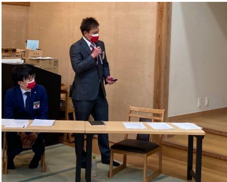
(上) 趣旨説明を行う茂野委員長（まちの未来をつなぐ委員会）