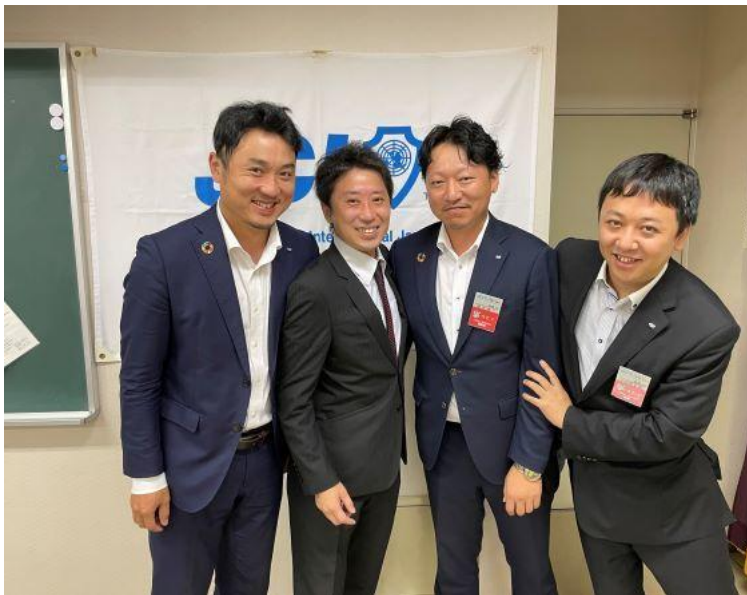
そして・・・自由形！