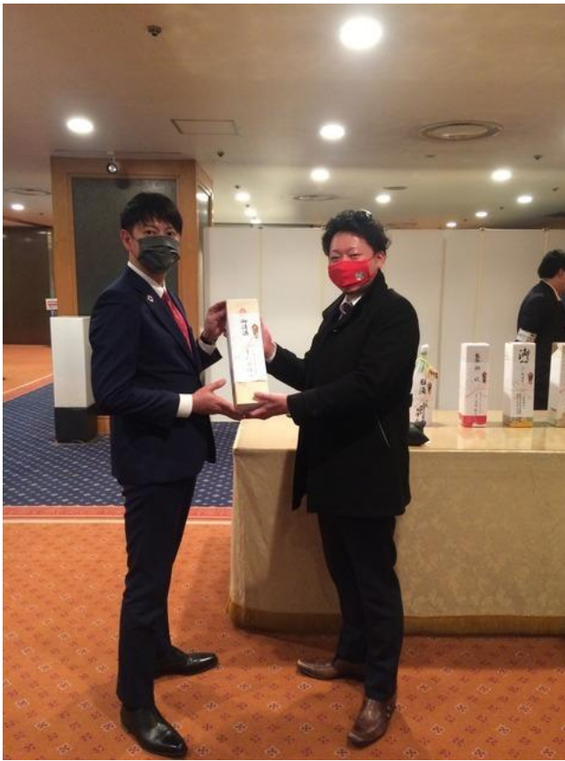
飛田会長 & 増井理事長 赤マスクが似合ってます！