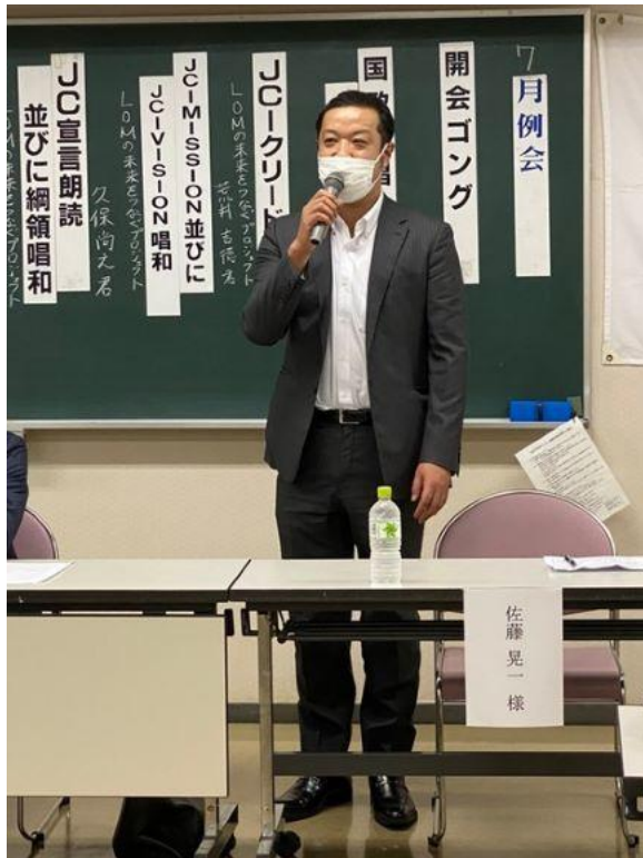
錚々たるパネラーの皆さまをお招きし、加茂JCへの入会をお誘いしておりますゲストの皆さまとともに、お話をうかがいました。