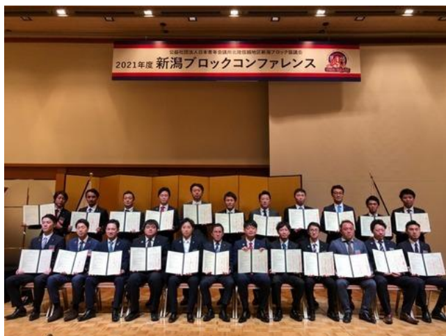
メインフォーラムを終え、災害時における救援相互運営規定の調印式を行い記念撮影をしました。 今回コロナ禍において、初めてのハイブリッド開催でした！ 久しぶりに対面で会えた仲間もあり、とても楽しむことができました！ 新潟ブロック協議会の皆様、本当にお疲れ様でした！